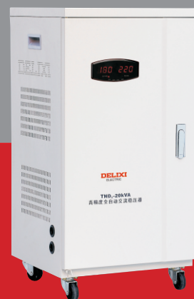
TND 2 -20kVA