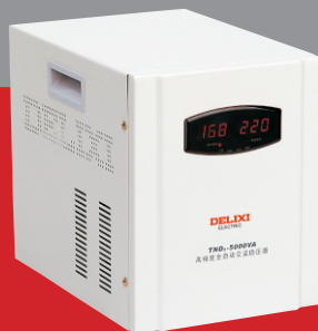
TND 2 -5000VA