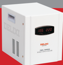
TND 2 -3000VA